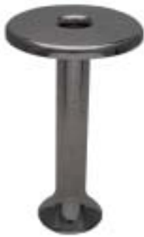
1936 – Βερολίνο