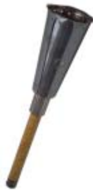
1952 – Ελσίνκι