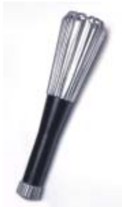
1968 – Μεξικό