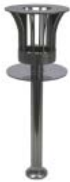
1948 – Λονδίνο