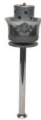
1956 – Μελβούρνη