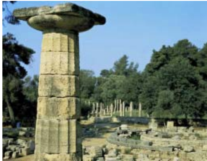
Αρχαιολογικός χώρος Ολυμπίας

Λίγο καιρό πριν αρχίσουν οι Ολυμπιακοί, τρεις σπονδοφόροι που φορούσαν στεφάνια ελιάς έφευγαν από την Ήλιδα για να αναγγείλουν την εκεχειρία. Αυτή στην αρχή διαρκούσε ένα μήνα και αργότερα (από τον 5ο αιώνα π.Χ.), τρεις μήνες (υπολογίζοντας από την ημέρα αναχώρησης των σπονδοφόρων). Κατά τη διάρκεια της ιερής εκεχειρίας, όλοι οι αθλητές και οι θεατές μπορούσαν να μεταβούν ανενόχλητοι στην Ολυμπία. Στην περιοχή της Ήλιδας απαγορεύονταν οι εχθροπραξίες, και κανείς δεν μπορούσε να μπει με όπλα. Εκτός από ελάχιστες εξαιρέσεις, η εκεχειρία τηρούνταν γιατί ήταν ιερή και γιατί οι Έλληνες απέδιδαν μεγάλη σημασία στις αθλητικές γιορτές. Η παραβίασή της θεωρούνταν ασέβεια προς τον ίδιο τον Δία, στον οποίο ήταν αφιερωμένη η γιορτή. Αναφέρεται ότι ο βασιλιάς της Μακεδονίας Φίλιππος Β', πατέρας του Μ. Αλεξάνδρου, ζήτησε συγγνώμη και πλήρωσε το σχετικό πρόστιμο, όταν ένας μισθοφόρος του εμπόδισε τον Αθηναίο Φρύωνα να πάει στην Ολυμπία για να παρακολουθήσει τη γιορτή.