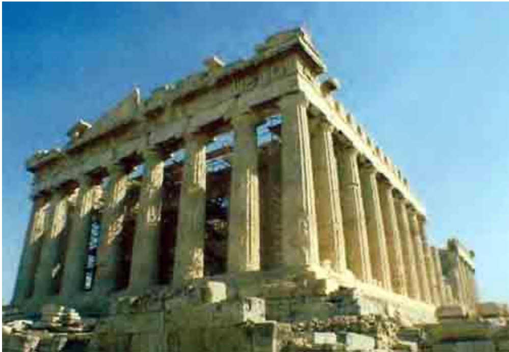
Φωτογραφία Αρ. 2: Ο Παρθενώνας ναός αφιερωμένος στη Θεά Αθηνά στην Ακρόπολη Αθηνών