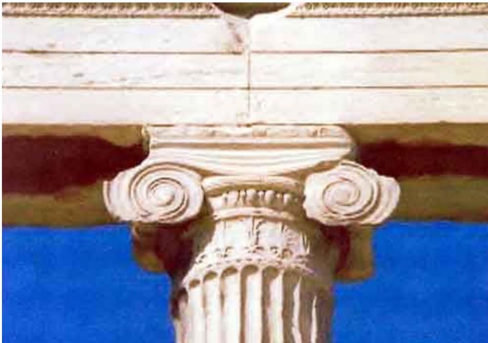
Φωτογραφία Αρ. 4: Λεπτομέρεια Κίονα Ιωνικού Ρυθμού στην Ακρόπολη Αθηνών στην Ελλάδα