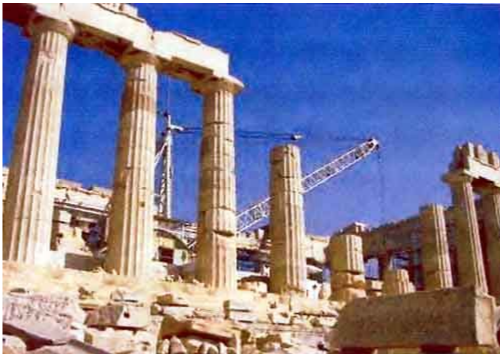
Φωτογραφία Αρ. 7: Αναστηλωτικά Έργα στον Παρθενώνα στην Ακρόπολη Αθηνών στην Ελλάδα