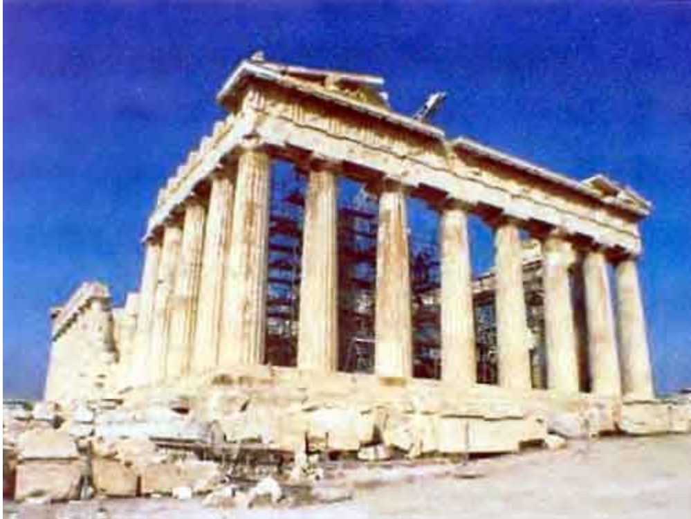
Φωτογραφία Αρ. 3: Ο Παρθενώνας στην Ακρόπολη Αθηνών στην Ελλάδα