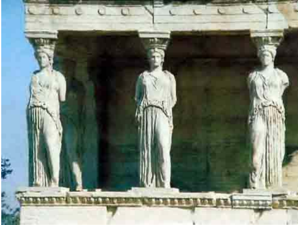
Φωτογραφία Αρ. 1: Οι Καρυάτιδες στο Ερέχθειο στην Ακρόπολη Αθηνών