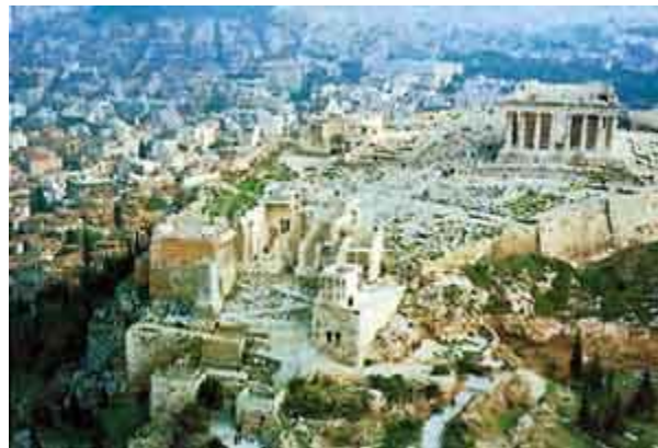
Φωτογραφία Αρ. 5: Πανοραμική άποψη της Ακρόπολης των Αθηνών στην Ελλάδα

Τη μορφή που έχει σήμερα ο Ιερός Βράχος την πήρε μετά τους Περσικούς πολέμους και μάλιστα από το 450 έως το 420 π.Χ., όταν άρχοντας της Αθήνας ήταν ο Περικλής. Αυτός ανάθεσε σε μεγάλους καλλιτέχνες όπως τον Φειδία , τον Ικτίνο , και τον Καλλικράτη , να ξανακτίσουν ό,τι είχαν καταστρέψει οι Πέρσες και να στολίσουν ξανά τον Ιερό Βράχο.