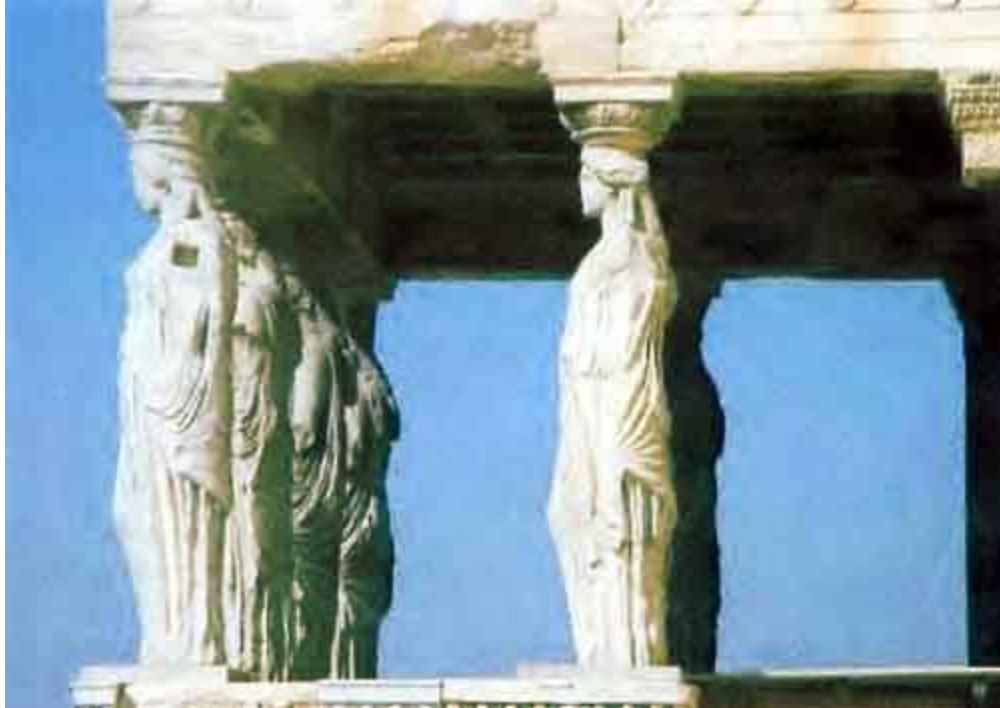
Φωτογραφία Αρ. 6: Οι Καρυάτιδες στο Ερέχθειο. Ακρόπολη Αθηνών στην Ελλάδα